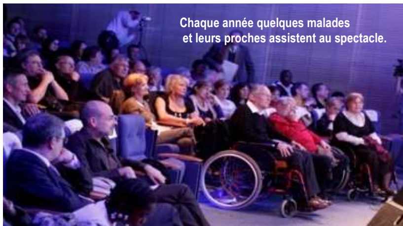
Chaque année quelques malades et leurs proches assistent au spectacle.

L'association Sylvain intervient en dernier ressort lorsque l'aide financière est indispensable pour débloquer une situation. Nous sommes un peu « les pompiers » de l'aide aux malades sans